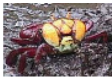
Pesquisadores produzem dados inéditos sobre caranguejo-uçá